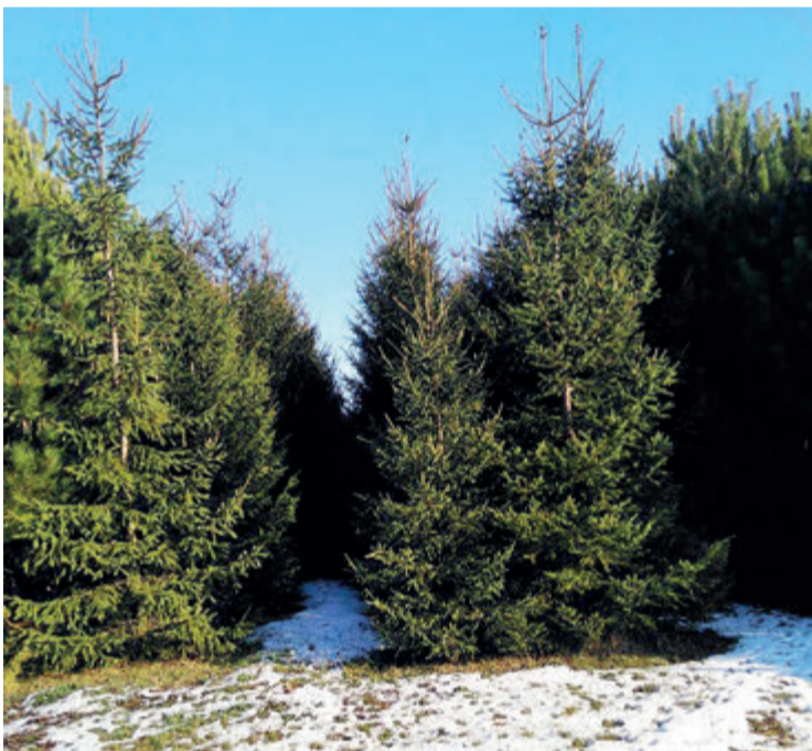
Ялиновий гай, де росте безліч грибів і живуть зайці та їжачки.

У нього були необхідні знання й досвід, а найголовніше – бажання втілити їх у реальну землеробську практику. Відтак 1993 року Сергій Леонідович заснував власне фермерське господарство. Втім, не так швидко й безперешкодно, як ми про це розповідаємо. Адже легкими стежками побігли переважно «везунчики»: одні правдами й неправдами спромоглися «приватизувати» цілі