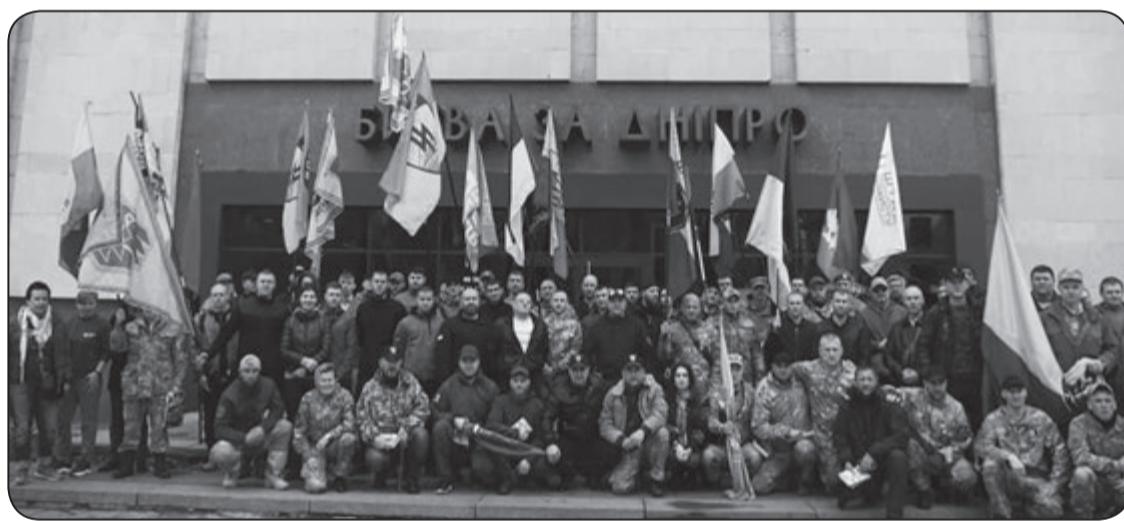
День українського добровольця у Дніпрі.

мак є проросійською людиною чи реальним агентом впливу? Та всі зазначили, що своєю діяльністю він рухає нашу країну в проросійський бік.